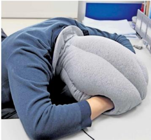
Abstrakt will man einfach sehr kurz haben. Auch im Bild: